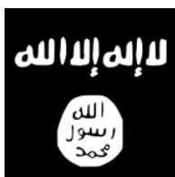
Seit Juni 2014 Islamischer Staat (IS)