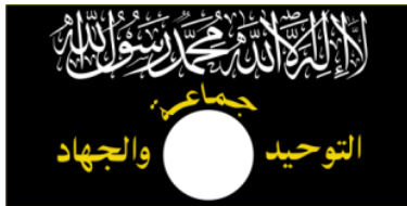
2001 bis Oktober 2004 Gruppe für Tauhīd und Jihad