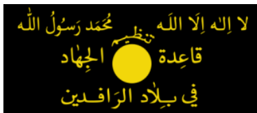
Oktober 2004 bis Januar 2006 Die Zentralverwaltung der al-Qaida im Zweistromland häufig auch: al-Qaida im Irak (AQI)